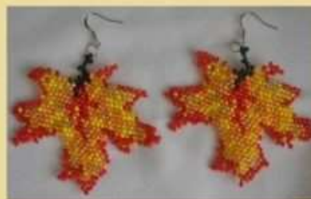
Кленовый листик. Способ 1