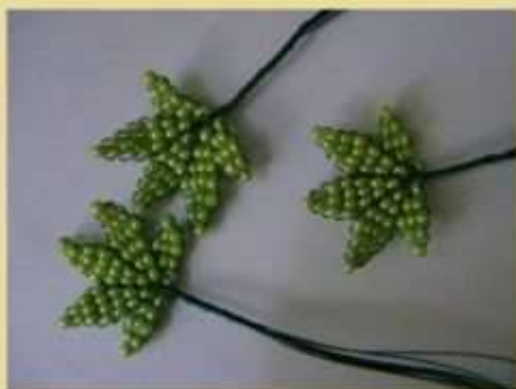
Кленовый листик. Способ 2