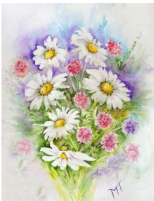
Рисунок выполнен цветными карандашами